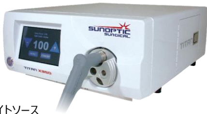
各種ライトソース ポータブルからハイエンドまで各種製品をご用意