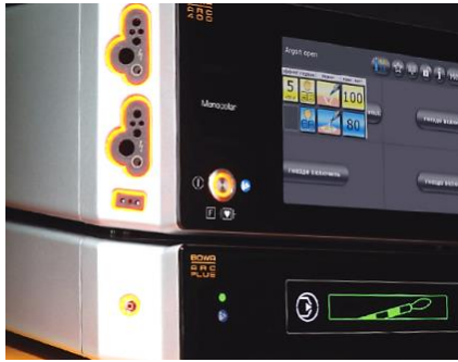
アルゴンガス凝固ユニット