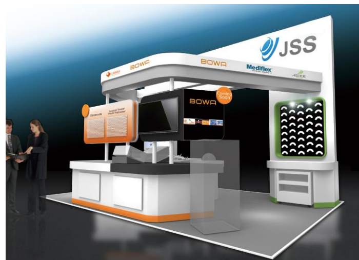
ブースNo.52でお待ちしております